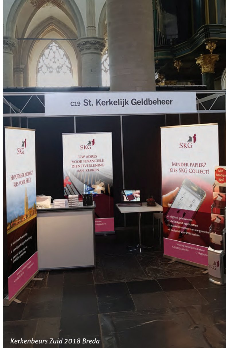
Kerkenbeurs Zuid 2018 Breda

De combinatie van een Kerkenbeurs en het kerkgebouw zorgde er voor dat sommige standhouders goed konden laten zien wat zij voor een kerkgebouw kunnen betekenen, zoals bijvoorbeeld met belichting. De entourage van het monumentale kerkgebouw nodigde ook uit om, naast de stoffelijke zaken, met elkaar te praten over de geestelijke zaken van het kerk-zijn. Zo waren er bijzondere geloofsgesprekken op de beurs.