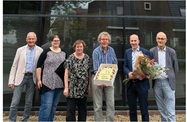
Vertegenwoordiging PG Medemblik en PG Opperdoes

Met de felicitaties is stilgestaan bij de 400ste PKN-gemeente met de Appostel app en bijbehorende kerkelijke webwinkel SKG Collect. PG Medemblik gaat Appostel samen met PG Opperdoes gebruiken voor de communicatie en digitaal collecteren.