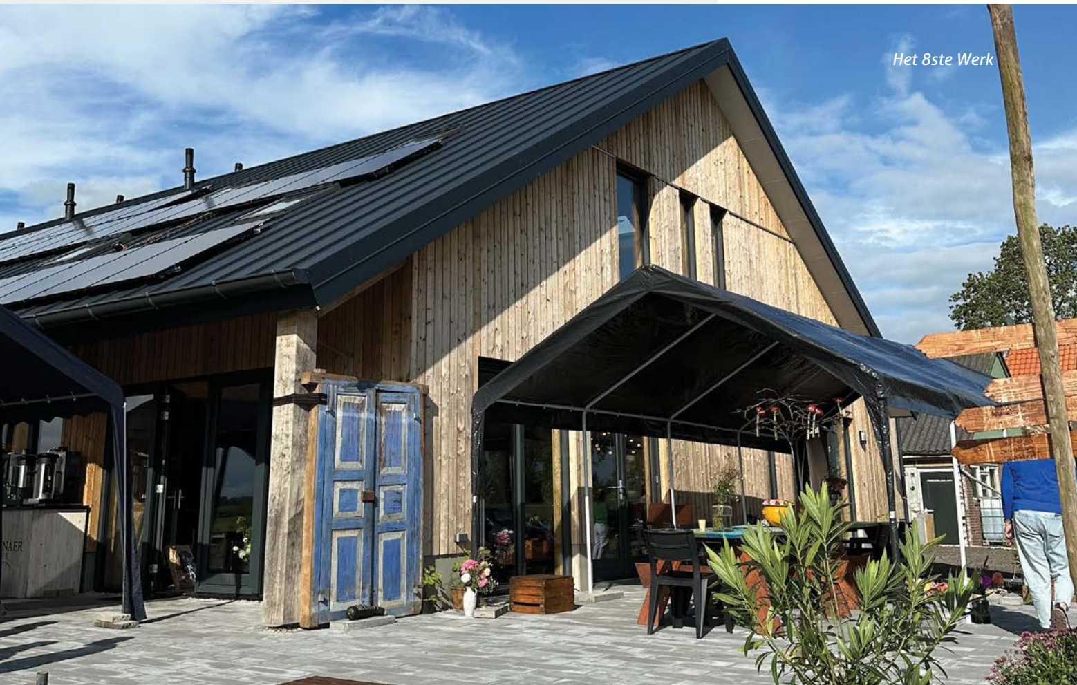
Het 8ste Werk